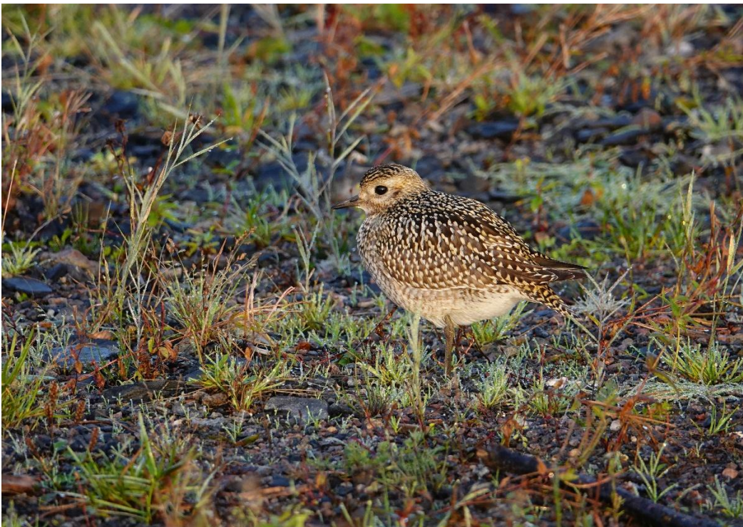
Kapustarinta (kuvituskuva).