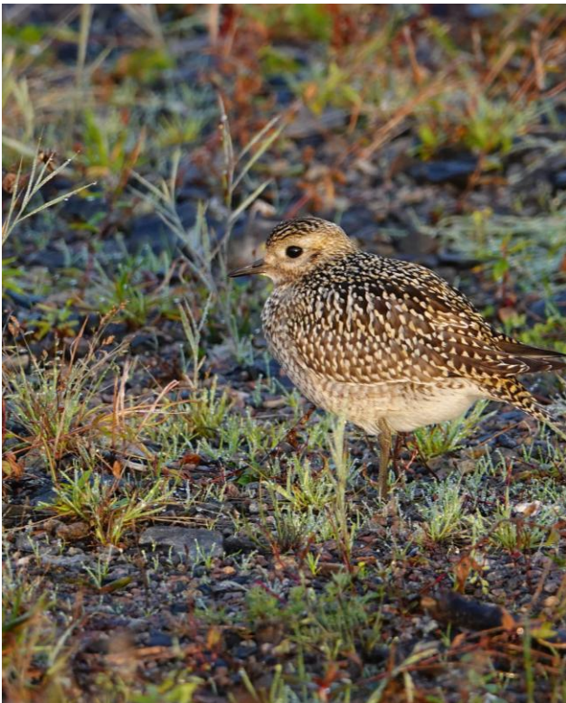
Kapustarinta (kuvituskuva).