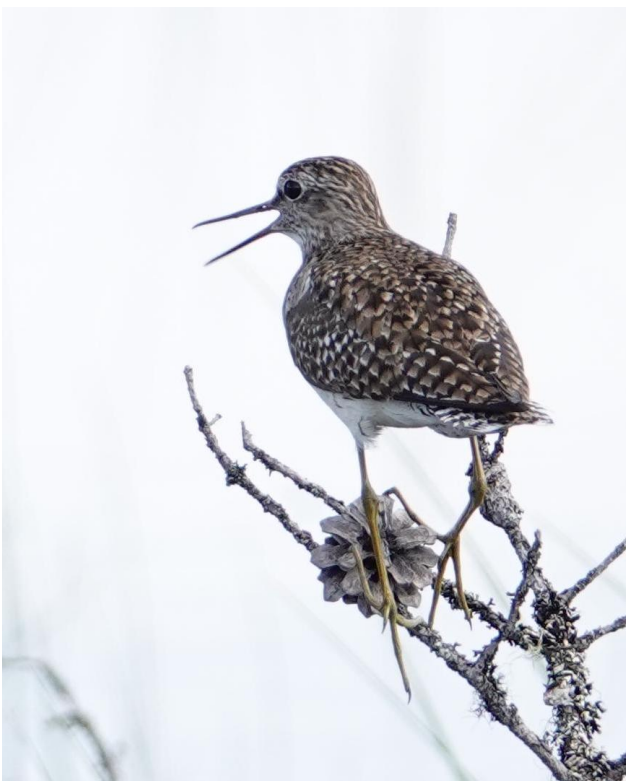
Liro (kuvituskuva).