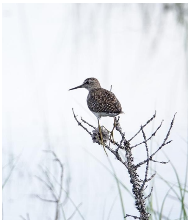
Liro (kuvituskuva).