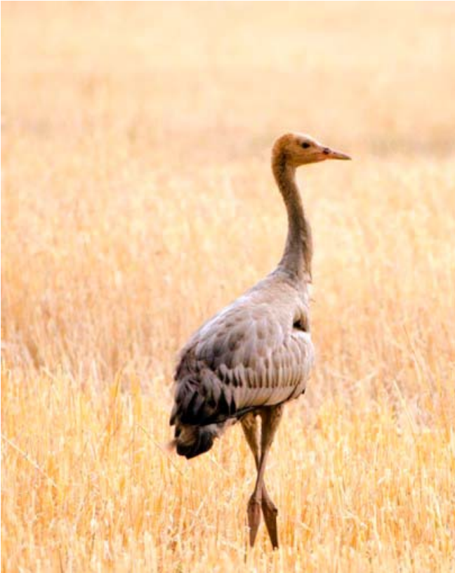
Siikajoen Hirvasperällä muista lajitovereista jälkeen jäänyt nuori kurki oli pahoin suolinkaisten heikentämä eikä selvinnyt. Kuva Henri Ukonaho.