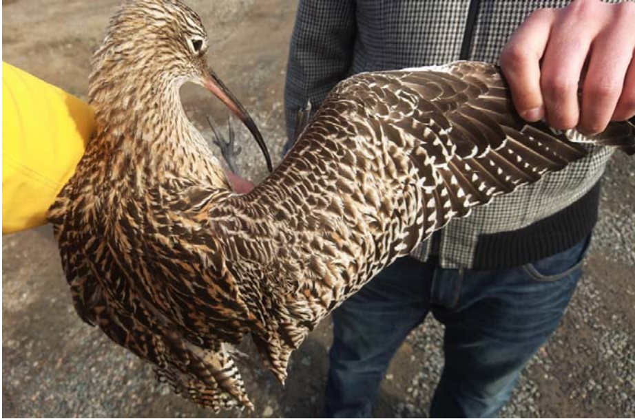
Kiimingin Alakylästä heikkokuntoisena löydetty vanha kuovinaaras siirrettiin sulalle pellolle 26.4. Kuva A-P Auvinen.