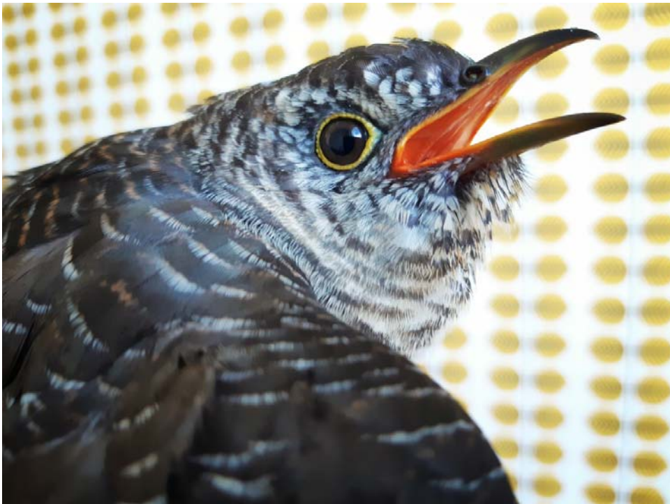
Oulun Rajakylästä 19.8. löytynyt nuori käki sain hieman painoaan takaisin ja vapautettiin Suomen luonnon päivänä 25.8. Siikajoen Merikylänlahdelle.