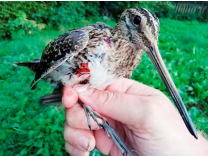
Pyhäjoelta löytynyt kissan kynsiin jäänyt taivaanvuohi vapautettiin yön tarkkailun jälkeen kissavapaalle alueelle Pattijokisuulle.