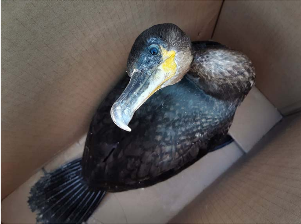
Oulu Meri-Toppilasta autokatoksesta 24.8. löytnyt nuori merimetso oli täynnä väiveitä. Se vapautettiin rengastettuna 29.8. Ranta-Toppilaan löytöpaikan lähelle.