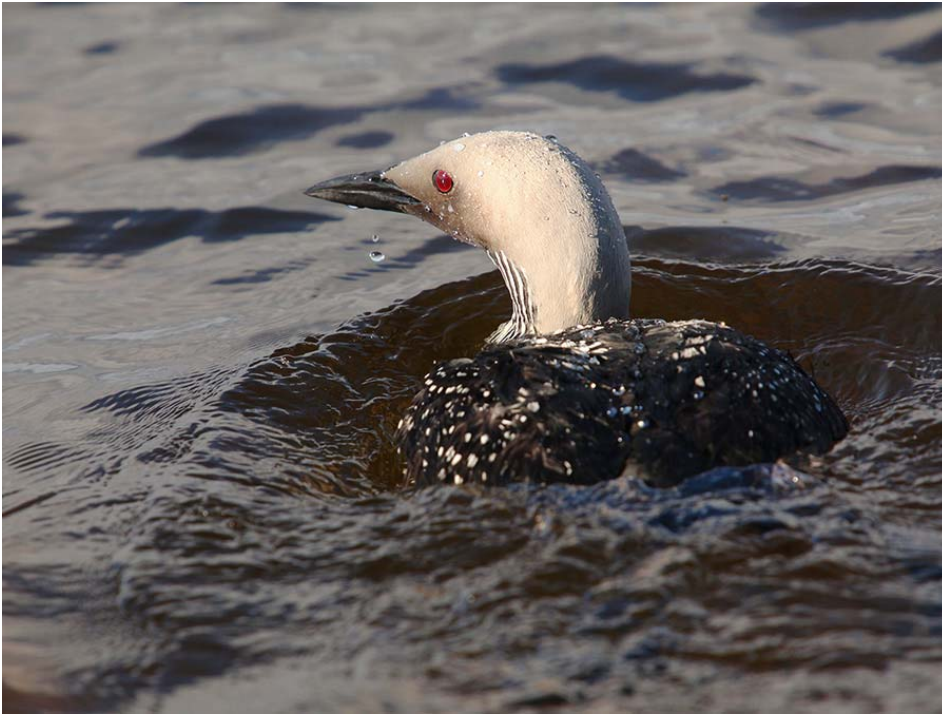
Kuva 3. Oulun Ruskosta teollisuusrakennuksen seinustalta 14.8. löytynyt kuikka oli mahdollisesti törmännyt kännykkämaston haruksiin.

Mitään poikkeuksellista ei loppukesässä–alkusyksyssä ollut, jollei sellaisena voida pitää nuorten kanahaukkojen suurehkoa määrää: Pihalinnun hoitolassa niitä kävi neljä ja Pattijoella yksi. Lisäksi Jani Suua haki Ranuan eläintarhaan hoidettavaksi nuoren kanahaukkanaaraan, joka oli törmännyt ikkunaan Pudasjärvellä. Lintu kuntoutui ja voitiin vapauttaa elokuun lopussa löytöpaikalle. Kanahaukoista saatiin myös rengaslöytö: Martinniemenestä 1.9. löytynyt ja kuusi päivää Pihalinnun hoitolassa ollut haukkanaaras löytyi kuolleena 28.1.2019 Oulun Parkkisenkankaalta. Tämä oli jälleen yksi osoitus siitä, että hoidossa ollut lintu on pärjännyt luonnossa – vaikka kokikin lopulta nuorille kanahaukoille tavallisen keskitalven kohtalon. Syksyn kanahaukkasummaan voidaan lisätä vielä Siikajoella katkenneen siiven vuoksi lopetettu yksilö sekä lissä Ikkunasta kesämökin sisälle päätynyt nuori koiras, jonka poliisit saivat vapautettua.