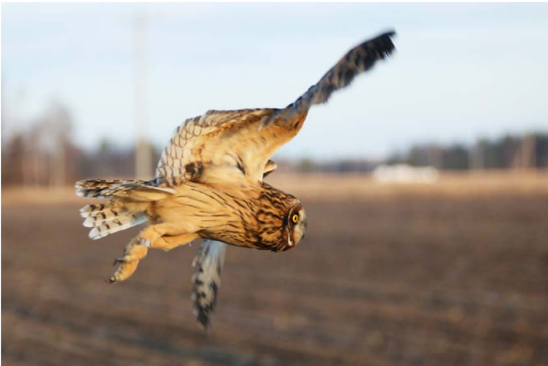
Pelkosenniementä lokakuun puolivälissä tien poskesta löytnyt nuori suopöllö oli hoidossa Ranualla, josta se tuotiin talvea karkuun etelämmäs ja vapautettiin 27.10. Limingan Honkisuolle.