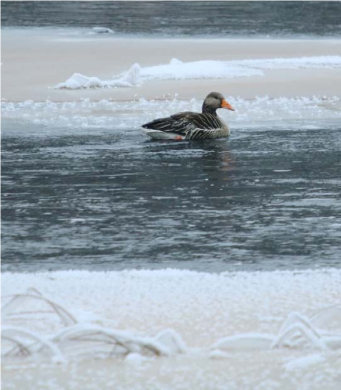
Siikajoen Ruukinkoskeen joulun alla ilmestynyt merihanhi paljastui tarhakarkulaiseksi. Kuvassa lintu jouluattoaamuna.