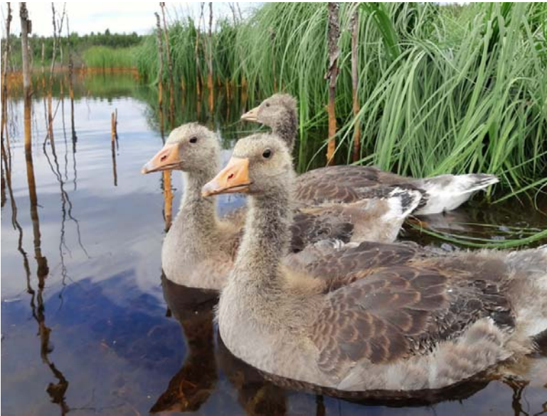
Kuva 2. Kolme merihanhen orpopoikasta varttui lentokykyisiksi Siikajoen Karjonevalla.